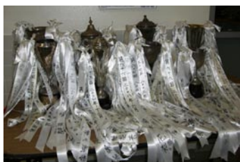
次の夏季水泳大会で優勝者に授与される歴史ある水泳クラブのトロフィー

第1回大会より昨年まで長年にわたり使用されてきたトロフィーを、今度行われる夏季水泳大会で優勝した生徒に永久に授与するものと決定しました。