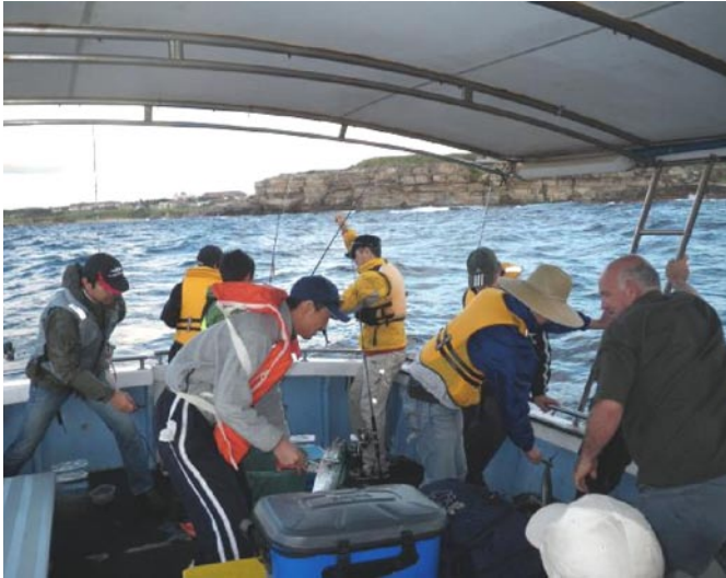
<カツオの爆釣で船内騒然!!>

日本人会釣りクラブは3月の例会を3月13日(土)にマラーブラ沖のインショア(岸よりの外洋)で開催しました。