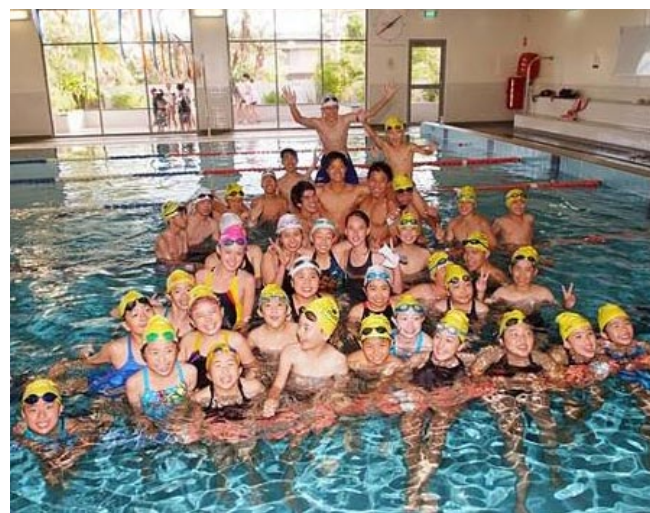
全員リレーのあとの記念撮影