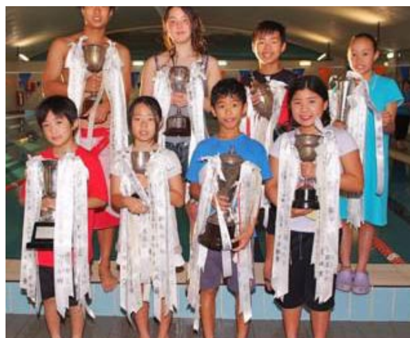
水泳クラブ伝統のトロフィーを受け取った各部門優勝者

12月号でお知らせしましたように、ビギナーステップには今年から再び5歳の生徒を受け入れます。保護者同伴ルールは基本的に一時休止いたしますが、安全上の理由でコーチが必要と判断した場合、お願いすることがあるかもしれませんのでご了承下さい。