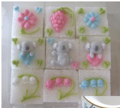
当日作成する作品