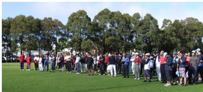
開会式に参加された選手の皆さん

今大会はどかが勝ってもおかしくないくらい、各チームの実力が拮抗していました。次回の大会は更なる戦国模様の大会となることは必至。次回の秋季大会を来年5月に開催する予定で準備を進めています。今大会出場できなかったチームの皆様も含め、ぜひ、次回大会への参加をお待ちしています。