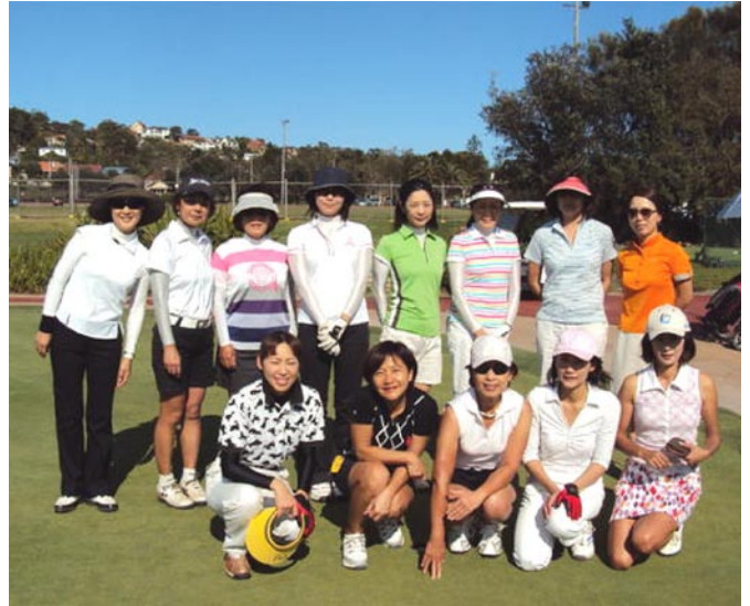
11月月例会参加のみなさん