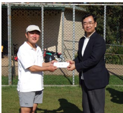
準優勝 JCS ソフトボーズ