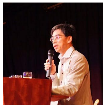
挨拶をする小原総領事