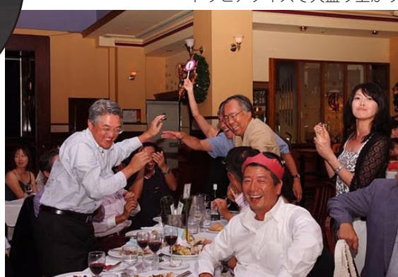
トリビアクイズで大盛り上がり