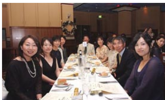
シドニー日本人学校のみなさん