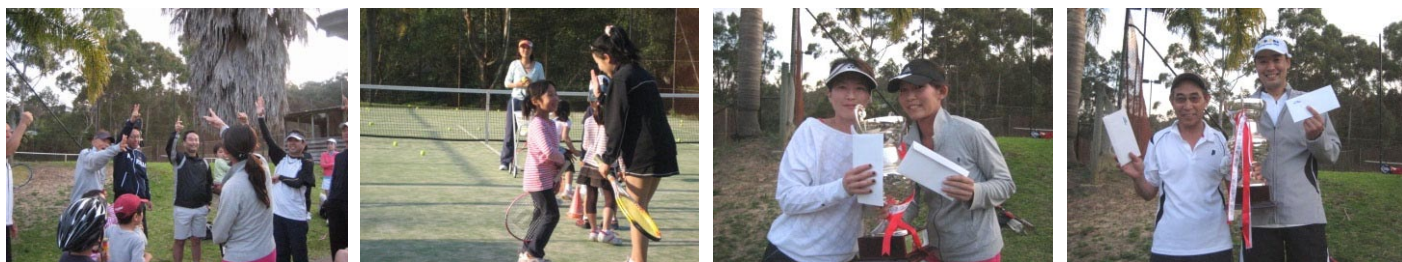
2010年春期オープン・ダブルス戦の様子