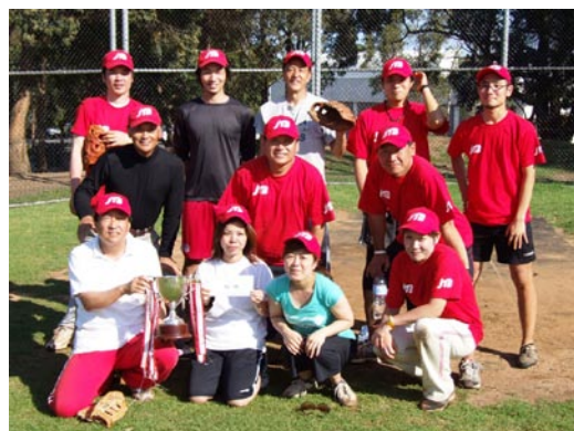
優勝のJTB ロッキーズの皆さん