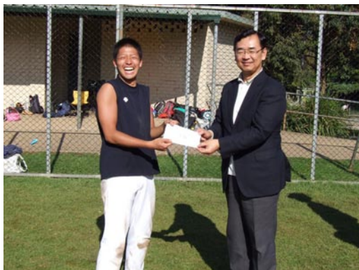
3位 PJ シャークス