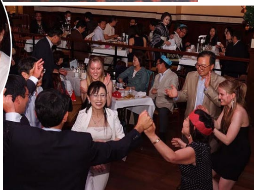
ダンスタイムを楽しむみなさん