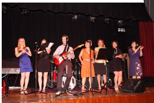
Cash Palace と一緒に舞台上で歌いました♪