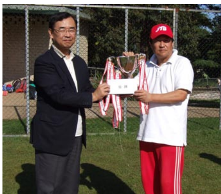
優勝 JTB ロッキーズ