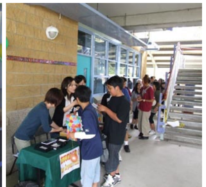
サイレントオークション会場の小原総領事ご夫妻 スピードくじ賞品引き換えの様子