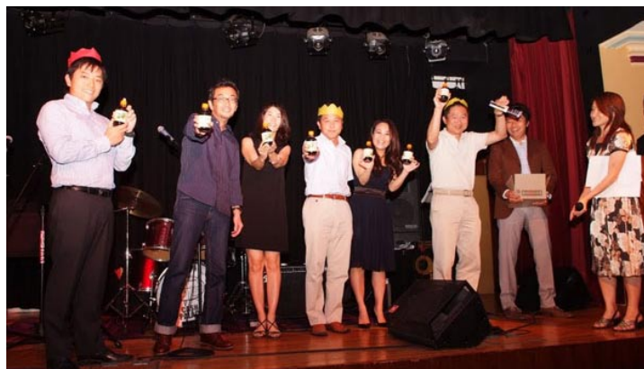
テーブル対抗トリビアクイズの優勝テーブルのみなさん